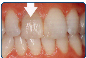
De tand is verkleurd

Tijdens de tweede behandeling brengt de tandarts de facing aan. Voordat de tandarts de facing aan uw tand plakt, behandelt hij uw tand voor met een zuur. Ook brengt hij een hechtlaag aan op uw tand. Op deze laag plakt hij de facing. Als u de vorm of kleur van de facing niet goed vindt, moet een geheel nieuwe facing in het tandtechnisch laboratorium worden gemaakt.