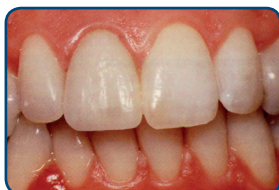
Op de tand is een porseleinen facing geplaatst