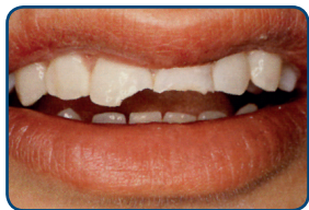
Door een val zijn twee tanden gebroken

Een facing is een laagje tandkleurig vulmateriaal van composiet of een schildje van porselein. De tandarts plakt het vulmateriaal op de tand.