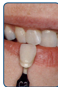
De gewenste kleur bepalen

Eerst kiest de tandarts in overleg met u de juiste kleur van uw facing. Het effect van de gewenste kleur kan de tandarts u direct laten zien. Hij heeft verschillende kleuren tot zijn beschikking die hij met elkaar kan combineren. U kunt het vergelijken met het mengen van verschillende soorten verf.