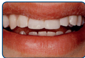
Nog dezelfde dag zijn de tanden met composiet hersteld