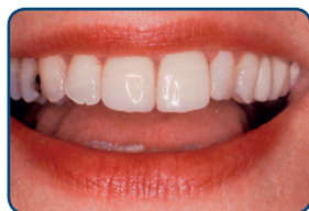
De facing van composiet heeft zowel de kleur als de stand van de tanden verbeterd