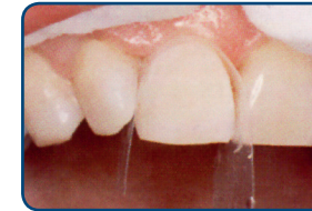
Nadat de ongeslepen tand is voorbehandeld met een zuur ziet het oppervlak er mat uit

Voordat uw tandarts de composiet aan uw tand plakt, behandelt hij uw tand voor met een zuur. Ook brengt hij een hechtlaag aan op uw tand. Op deze laag bevestigt hij de nog zachte composiet.