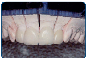
Porseleinen facings op een mal

Uw tandarts maakt een afdruk van uw tand. Die afdruk gaat naar het tandtechnisch laboratorium. Daar maken ze uw facing in de gewenste vorm.